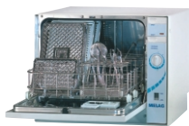
MELAclean - umývací a dezinfekčný automat