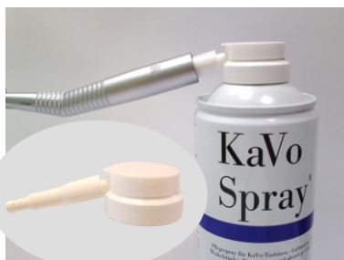
Turbína na rýchlospojku