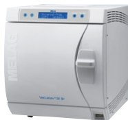
VACUKLAV 31B autokláv od firmy MELAG

Zabaľte kolenkový násadec alebo turbínu samostatne do vhodného sterilizačného sáčku a vložte do sterilizátora. Kolienkové násadce a turbíny sa môžu sterilizovať v autoklávoch do 135°C.