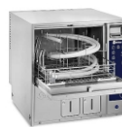
Steelco - termodezinfektor