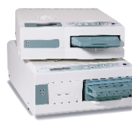
STATIM 2000S a 5000S kazetový autokláv od firmy SciCan